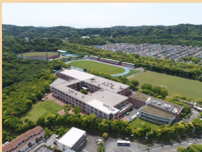
関東学院大学総合グラウンド (横浜・金沢文庫キャンパス)