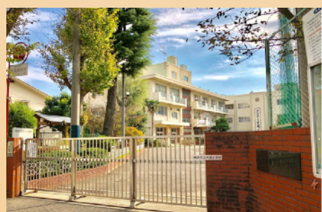
大道小学校 (● 地域防災拠点)