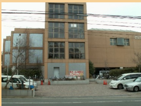
六浦地区センター