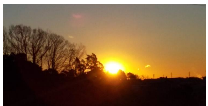
山王神社から見える初日の出