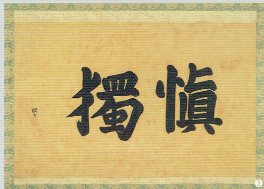
掲載資料(表面) 「米倉家集合写真」(明治時代)(米倉家所蔵) / 「米倉昌言肖像写真」(明治時代)(米倉家所蔵) / 「三侯大明神祭礼行列之図」(米倉家所蔵) 掲載資料(裏面) ①「日記」(慶応4年(1868)～明治4年(1871)) (金沢藩士萩原家文書、当館蔵) ②「米倉丹後守陣屋全図」写、角田武夫画(寛政10年(1798)作成、明治32年(1899)写)(角田家所蔵、神奈川県立金沢文庫保管) ③「徳川綱吉書「獨慎」」(元禄7年(1694)か)(米倉家所蔵)