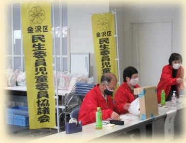
今年の3月に実施したときの様子

《主催》 金沢区民生委員児童委員協議会 金沢区社会福祉協議会 《協力》 金沢区役所